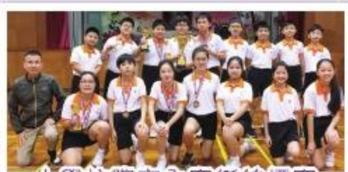
小學校際室內賽艇錦標賽