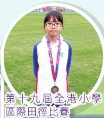
第十九屆全港小學區際田徑比賽