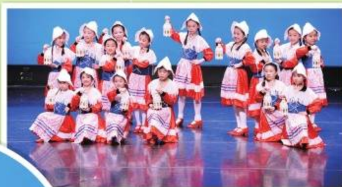
第53屆學校舞蹈比賽

第53屆學校舞蹈比賽 取得3項優等獎、4項甲級獎，第九度獲全港小學組現代舞團體冠軍。