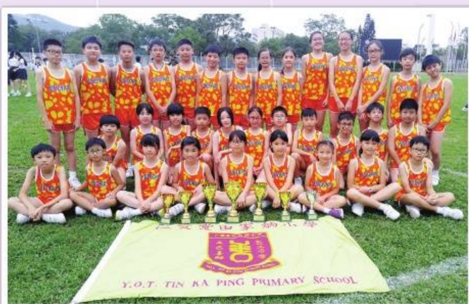
第二十屆西貢區小學校際田徑比賽