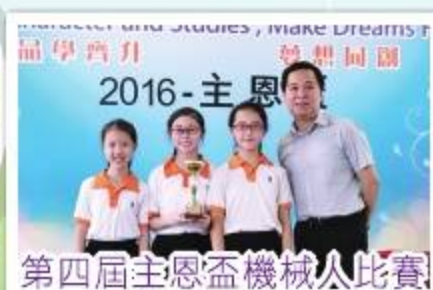
第四屆主恩盃機械人比賽