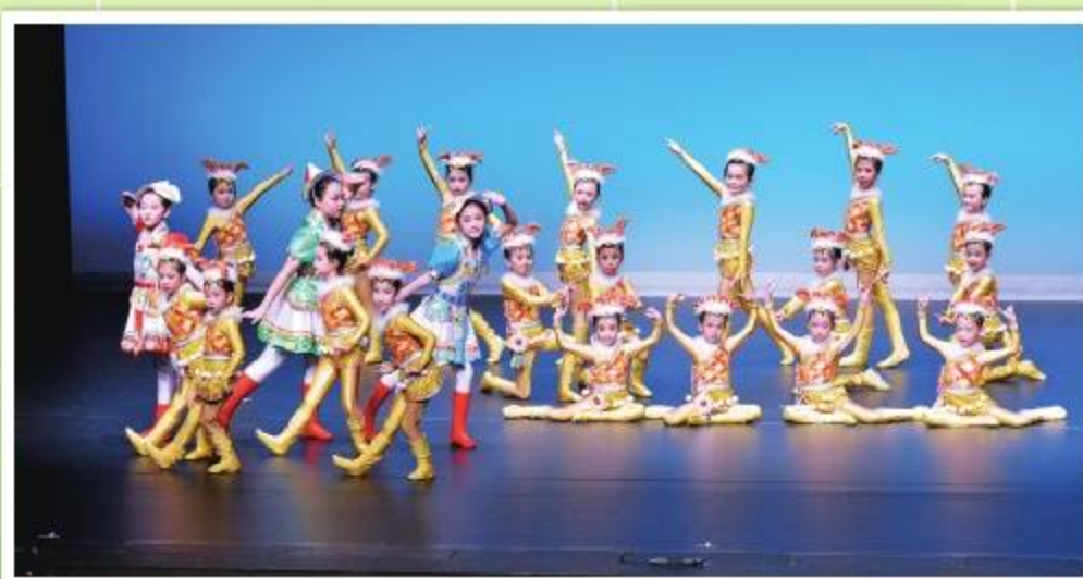
第53屆學校舞蹈比賽