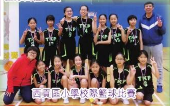
西貢區小學校際籃球比賽