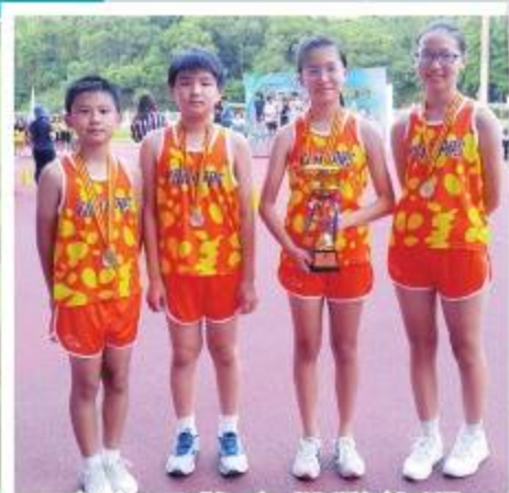
東華三院小學聯校運動會友校接力邀請賽