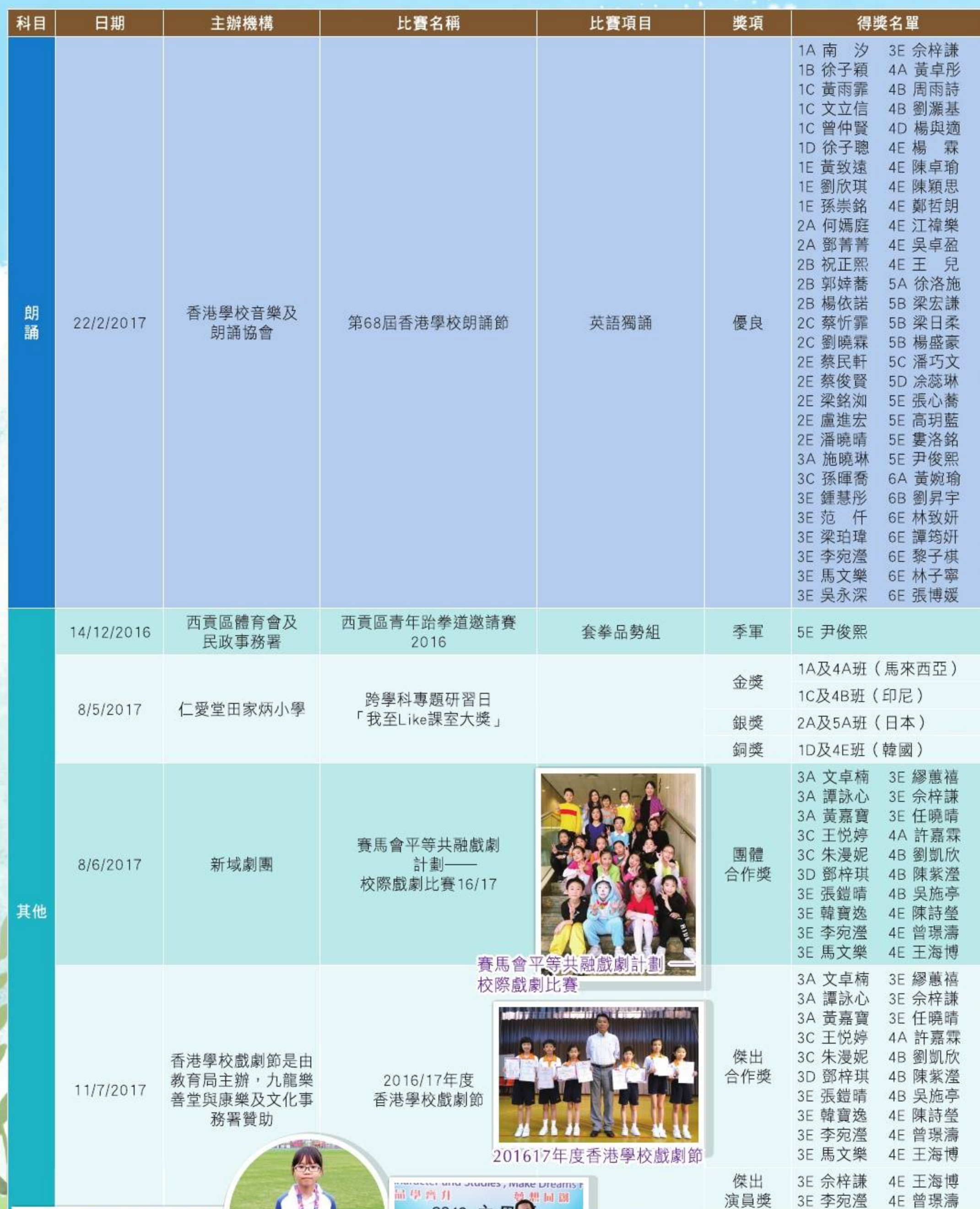
賽馬會平等共融戲劇計劃校際戲劇比賽