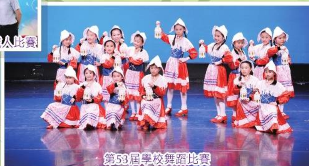
第53屆學校舞蹈比賽